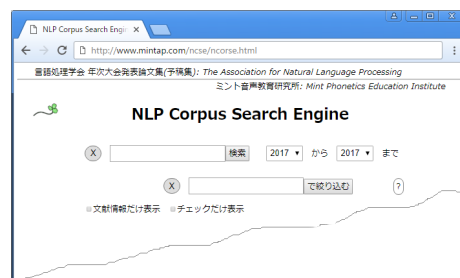
図 1. NaCSE の初期画面