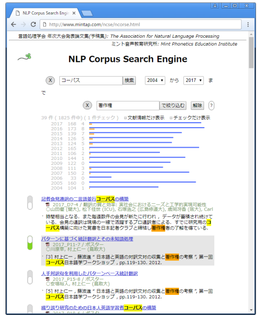
図 2. NaCSE での検索結果表示の様子 主検索語はコーパス, 副検索語は著作権

NaCSE で検索すると, コーパスの先行研究としては, 形態素解析 (224 件) や語彙 (259 件) などが多いが, 今回は初級者が所望の文献を文脈検索するエンジン開発をめざした。結果としては, 著作権に関する先行研究で取り上げた 4 つの論文を素早く見つける事によって NLP での議論について知ることができるなどの効果を実感した。これまで筆者が使っていたグーグル